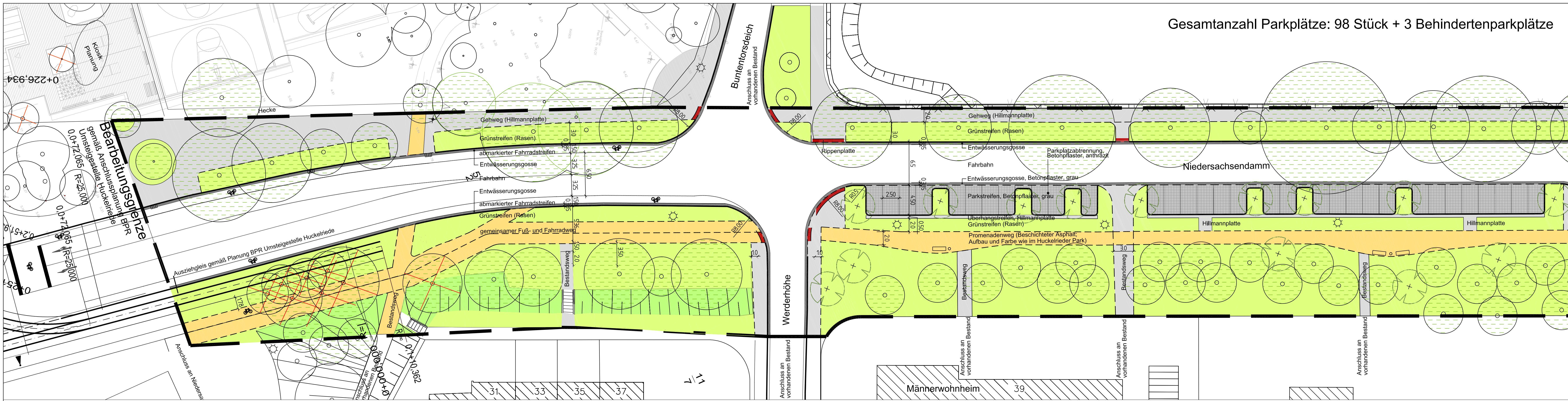
Lageplanausschnitt 1 - M 1:250