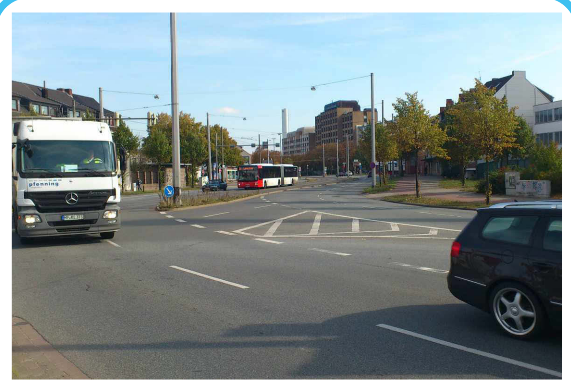
Personen- und Wirtschaftsverkehr müssen jeweils berücksichtigt werden.