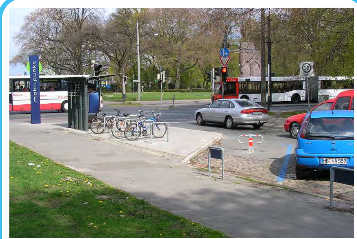
Intelligente Verknüpfung von mehreren Verkehrsmitteln.