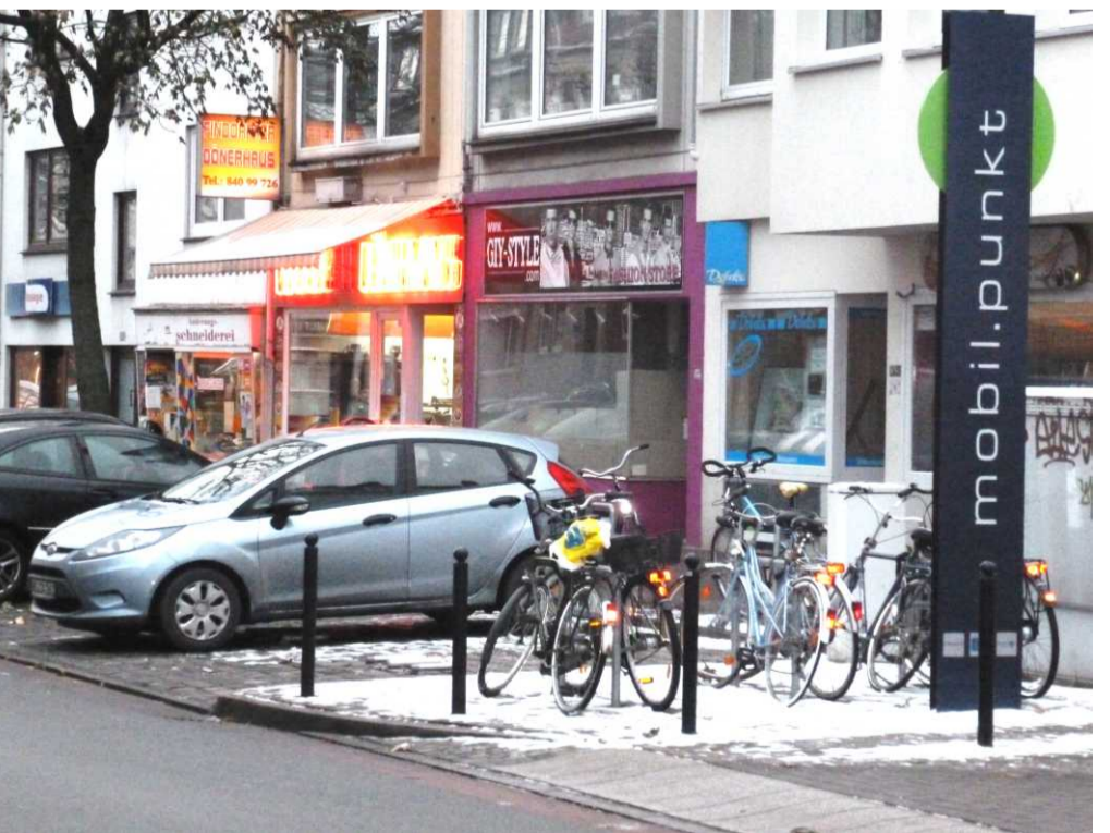
Verknüpfung Carsharing und Nahmobilität mit Abstellmöglichkeiten für Fahrräder an der Station Admiral in Findorff.