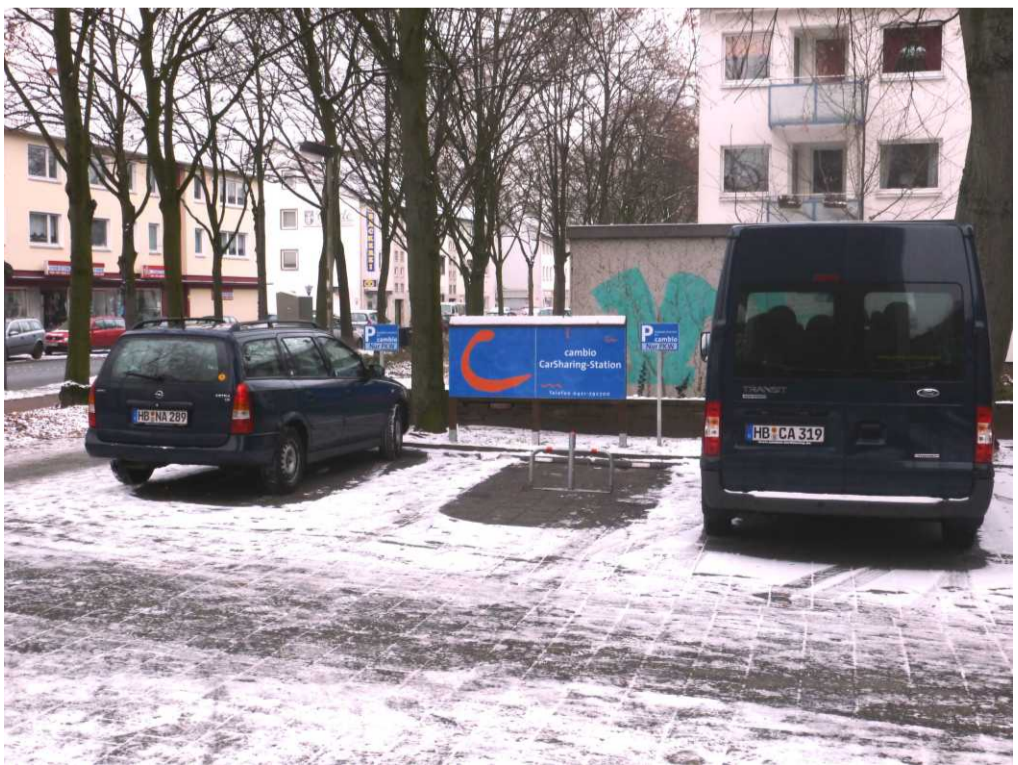
Carsharing im Quartier: Die Station Steffen in Walle auf dem Parkplatz der St.-Marien-Kirche.