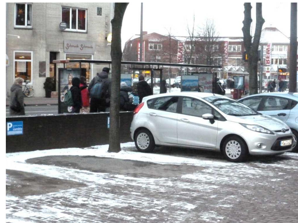
Verknüpfung Carsharing und öffentlicher Nahverkehr mit Nähe zu Haltestellen an der Station Luther in Findorff.