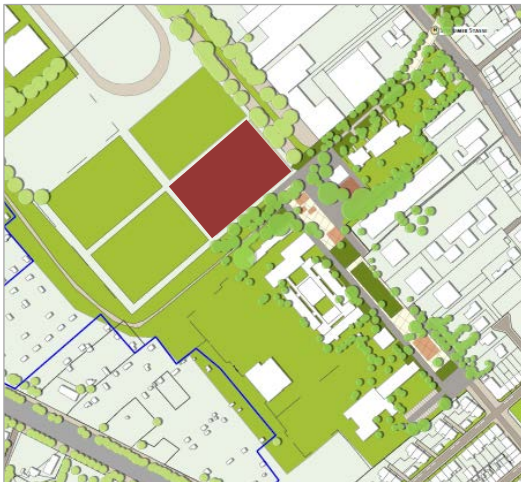
Ausschnitt: Städtebaulicher Rahmenplan