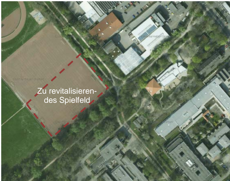
Luftbild: nordöstlicher Bereich der Bezirkssportanlage Süd