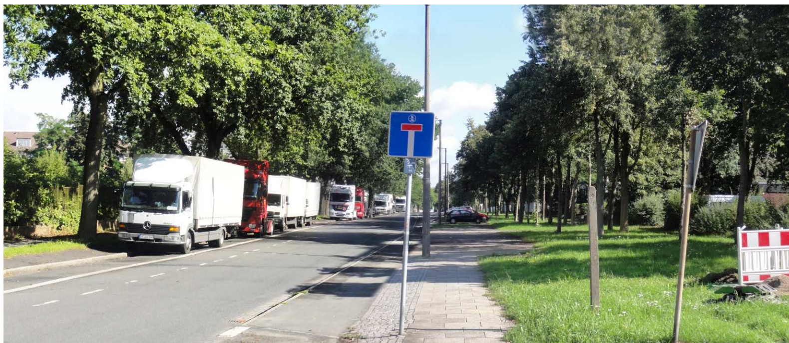
Bestandssituation Sommer 2010