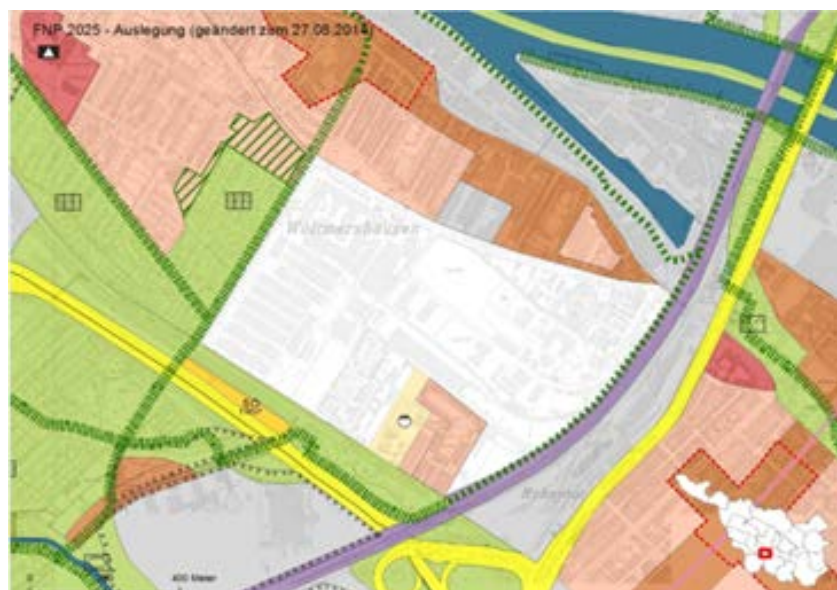
Auszug aus dem Flächennutzungsplan