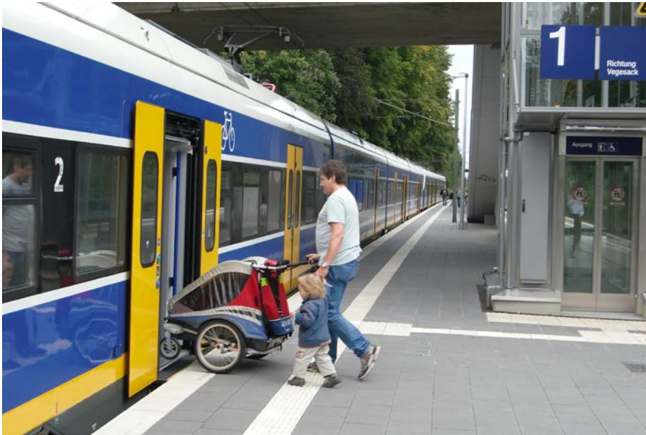
Abb. 2: Beispiel einer modern gestalteten, barrierefreien Station mit einfachem Zugang zu den Fahrzeugen: Bremen-St. Magnus

Bereits weitestgehend barrierefrei ausgebaut ist der Bahnhof Bremen-Vegesack . Zur abschließenden Modernisierung und Verbesserung des gesamten Erscheinungsbildes und der subjektiven Sicherheit wird eine neue Beleuchtungsanlage installiert. Weiterhin hat die Station bereits ein neues Fahrgastinformationssystem mit dynamischen Anzeiger und komplett neuer Beschilderung erhalten. Als Ergänzung wird das Bahnsteigmobiliar erneuert. Ferner hat der SUBV entschieden noch ein taktiles Blindenleitsystem ergänzen zu lassen. An beiden Bahnsteigkanten und der Hauptzuwegung sind nun entsprechende Rillenplatten verlegt worden. Die Fertigstellung der Station ist bis Mai 2013 vorgesehen.