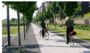
Wassergebundene Decke (anthrazit)

Entwurfsplanung zur baulichen Sanierung und gestalterischen Erneuerung des Buntentorsdeichs (Umweltbetrieb Bremen, August 2018)