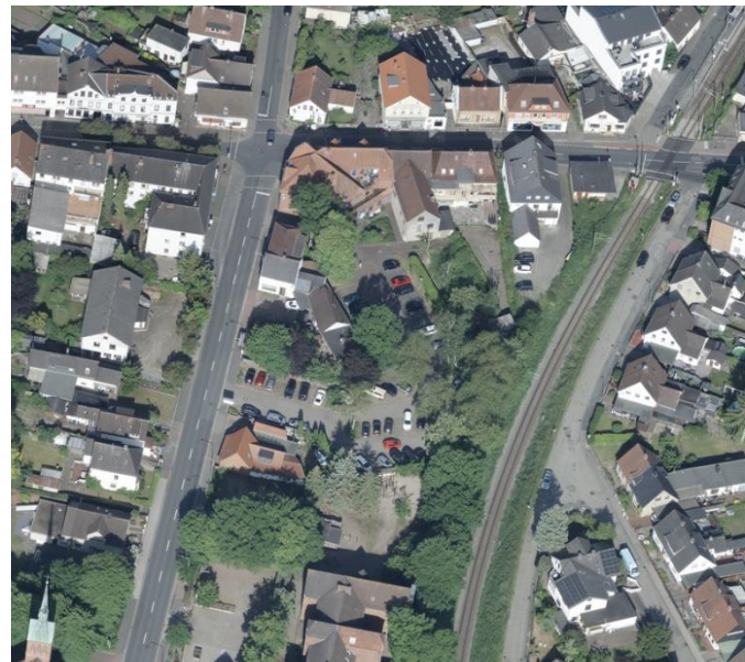
Luftbild vom Plangebiet