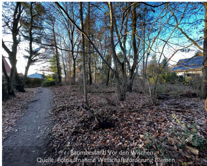
Baumbestand Vor den Wischen

Ungefähr 1/6 der insgesamt 6 ha umfassenden Innenfläche soll als Bauland für ein neues Wohnquartier ausgewiesen werden.