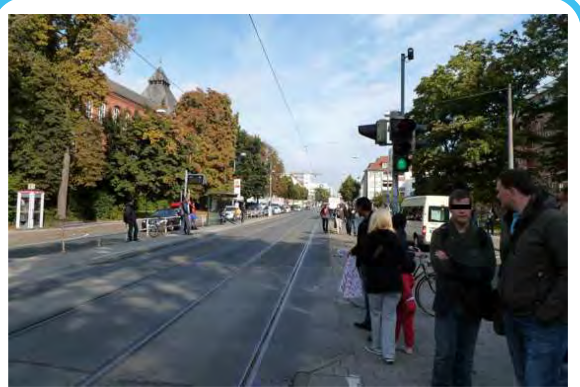
Viele Verkehrsteilnehmer müssen sich den Straßenraum teilen.

Unter bremenbewegen.de finden Sie übrigens auch weitere Informationen und Möglichkeiten zur Teilhabe am Verkehrsentwicklungsplan 2025.