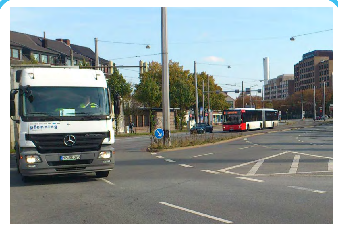
Personen- und Wirtschaftsverkehr müssen jeweils berücksichtigt werden.