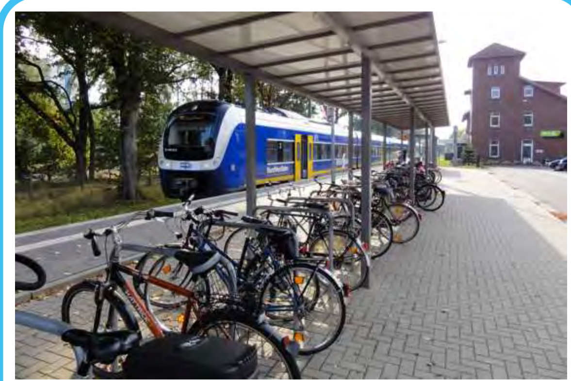
Intelligente Verknüpfung von mehreren Verkehrsmitteln (hier: Bf. Farge).