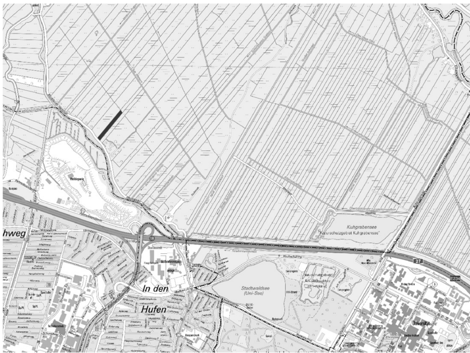
Abb. 4: Lage der Kompensationsflächen (naturschutzrechtliche Eingriffsregelung), Gemarkung VR 336, Flur 34

Es handelt sich um eine Grünlandparzelle im Bremer Blockland. Sie befindet sich in städtischem Eigentum mit einer Flächengröße von 1,32 ha. Es handelt sich um die Gemarkung VR 336, Flur 34.