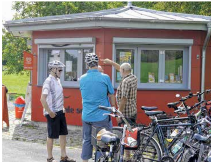
Der Kiosk am Deichschart.