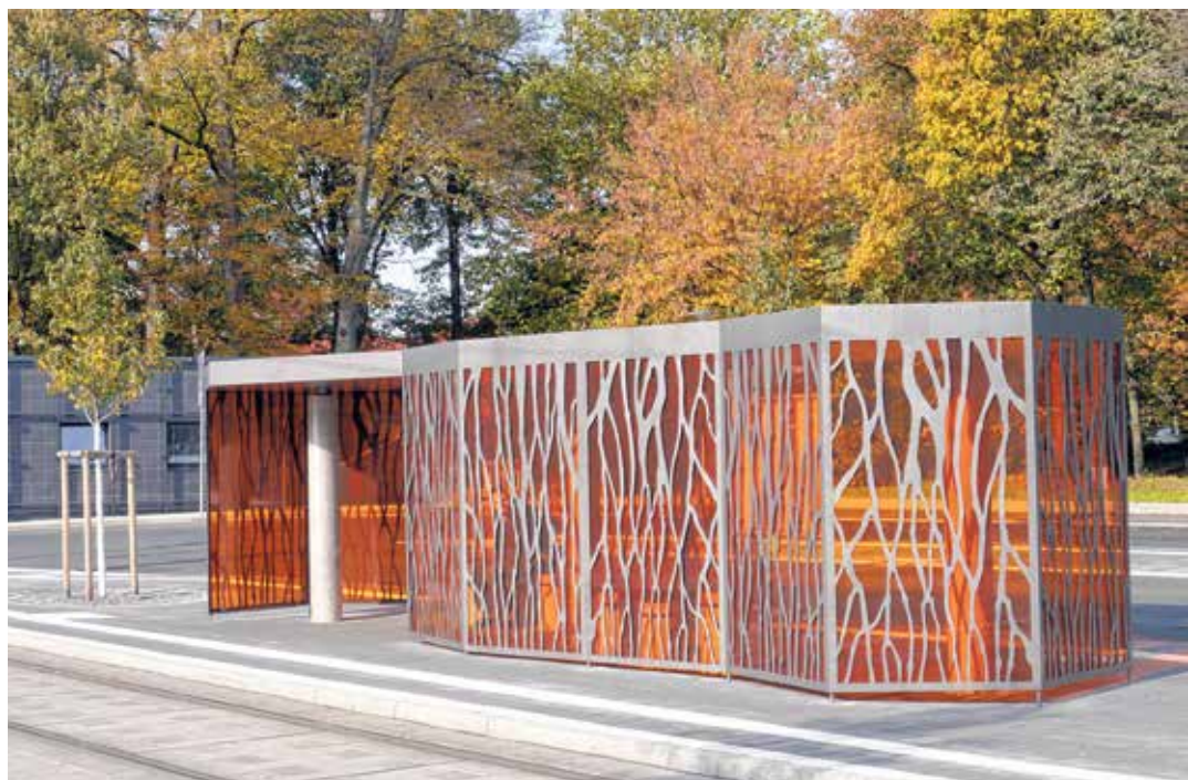
Das neue Haltestellenhäuschen an der Umsteigestelle Huckelriede (oben).

Sollte alles so umgesetzt werden wie derzeit geplant, so wird Huckelriede im Jahr 2020 ein noch lebens- und lebenswerterer Stadtteil mit neugestalteten öffentlichen Freiräumen sowie mit einer weitaus breiteren Palette an Angeboten verschiedenster Träger sein, als er bereits heute ist. Dafür werden der Bund und die Stadtgemeinde Bremen umfassende Mittel aus Städtebauförderung und dem Programm WiN eingesetzt haben.