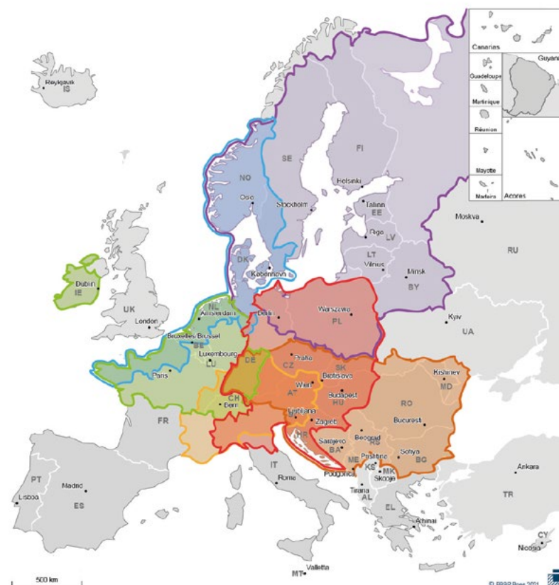
Transnationale Programmräume mit deutscher Beteiligung 2021 – 2027 (Interreg B)